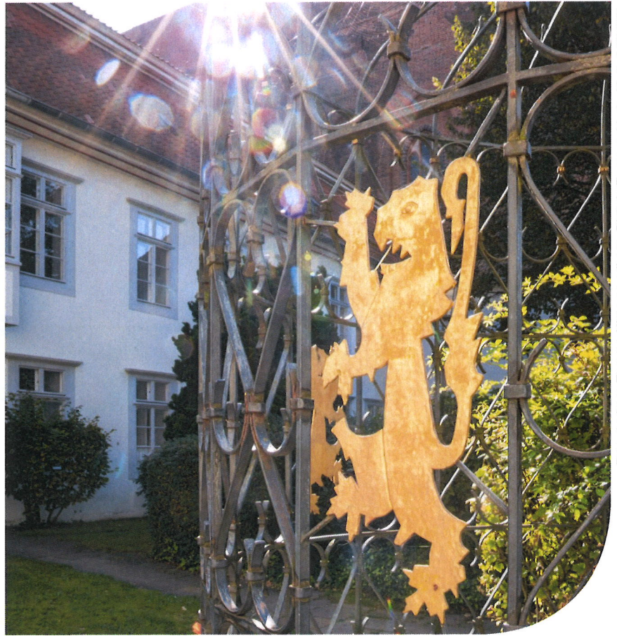
Foto: Andreas Tamme, Hintergrundkarte: Digitale Topographische Karte 1:50.000 © GeoBasis-DE/LGLN 2018